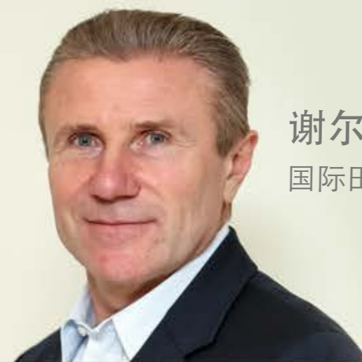
谢尔盖·布勃卡 国际田联主席候选人

www.athletics2015.org Twitter: @sergey_bubka